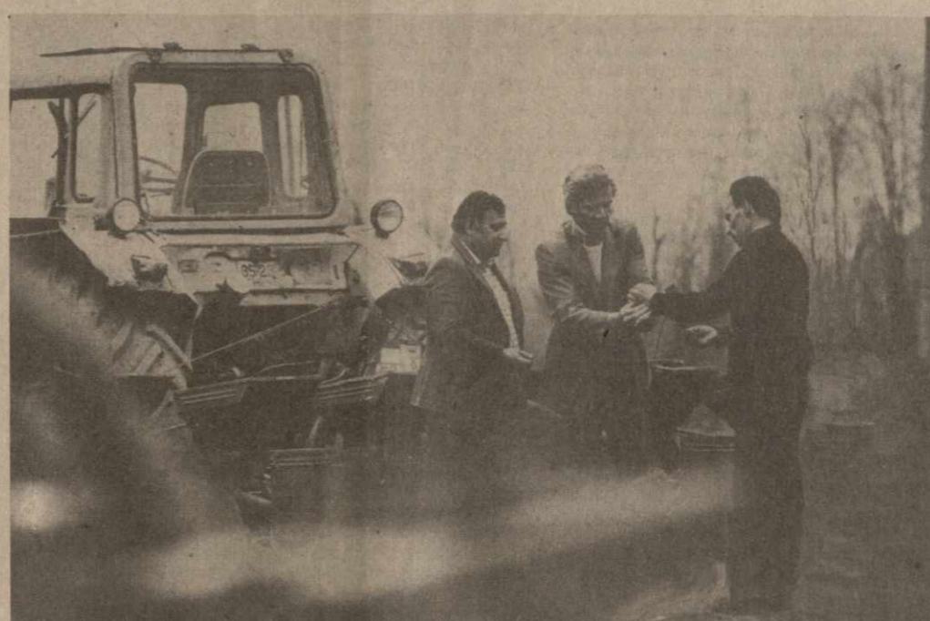
На полях колхоза села Кахати Зугдидского района завершается весенняя посевная кампания. Под яровой пашней отведено 580 гектаров, значительную часть из них займут кукуруза на зерно и силос, многолетние травы. Прочная кормовая база, созданная в колхозе, — гарантия растущих успехов животноводов.

На заседании Политбюро ЦК КПСС обсуждены также некоторые другие вопросы государственного строительства и общественно-политической жизни страны.