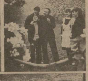
Коллектив работников в эти весенние дни. На снимке — передовые механизаторы хозяйства