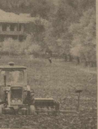
Коллектив работников в эти весенние дни. На снимке — передовые механизаторы хозяйства