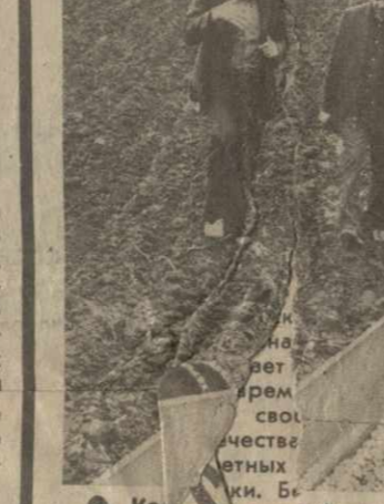
Коллектив работников в эти весенние дни. На снимке — передовые механизаторы хозяйства