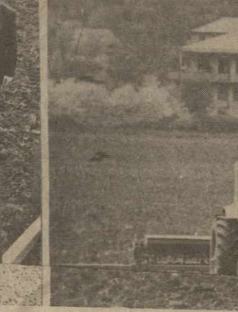
Коллектив работников в эти весенние дни. На снимке — передовые механизаторы хозяйства