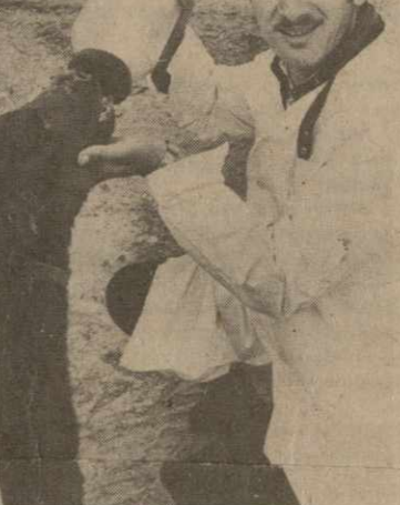
Коллектив работников в эти весенние дни. На снимке — передовые механизаторы хозяйства