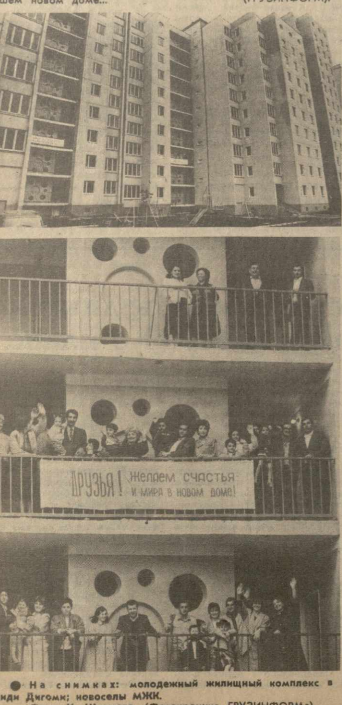
На снимках: молодежный жилищный комплекс в Диди Дгоме; новоселы МЖК.