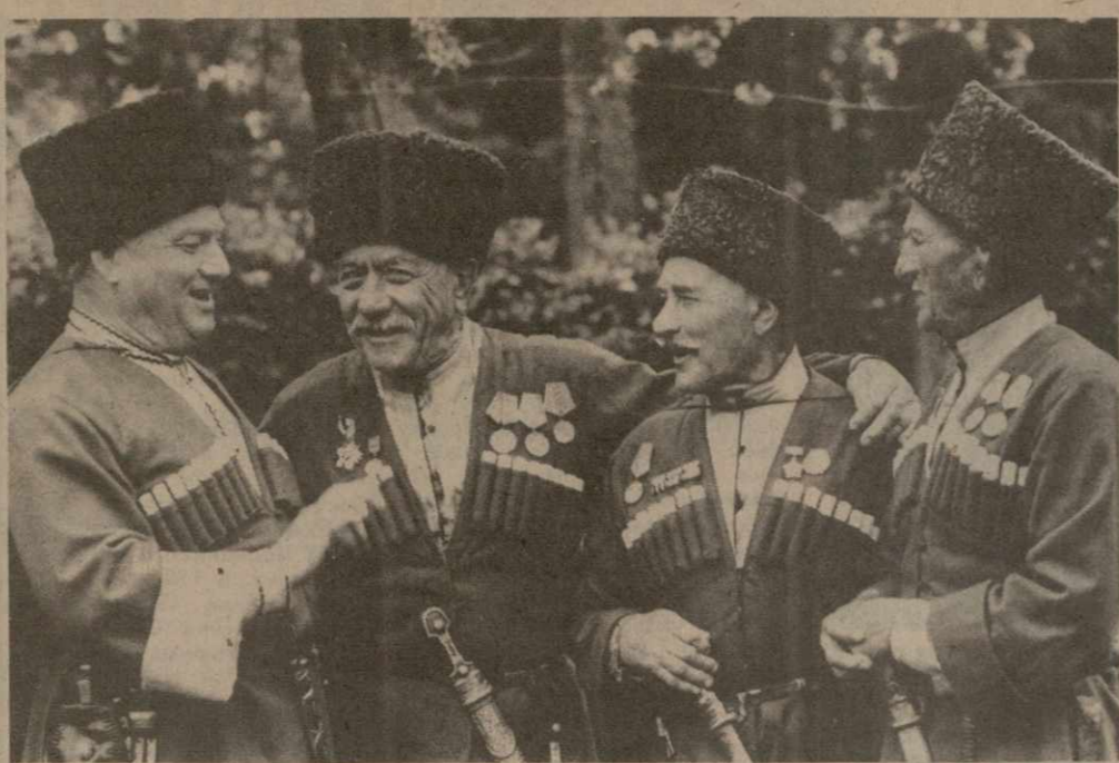
Они были молоды в дни Великой Отечественной, героически сражались с ненавистным врагом. Их праздничные чоки украшены боевыми и трудовыми наградами. И сегодня старейшины колхоза села Дуррипы Гудаутского района — в гуще общественной жизни: делятся опытом, воспитывают молодежь на славных традициях. Ветераны войны и труда — участники известного этнографического ансамбля абхазских долгожителей «Нарта».

В Кутаиси состоялась учредительная конференция Кутаисского Общества Руставели. В ее работе приняли участие делегаты первичных организаций этого общества, предприятий и учреждений, представители общественности города, писатели, деятели науки и культуры, руководители партийных, советских и хозяйственных организаций городов и районов Западной Грузии, молодежь, представители духовенства. Выступивший на конференции председатель правления республиканского Общества Руставели поэт-академик Ираклий Абашидзе говорил о большой работе, проделанной в республике по созданию общества, всенародной любви к автору «Витязя в тигровой шкуре».