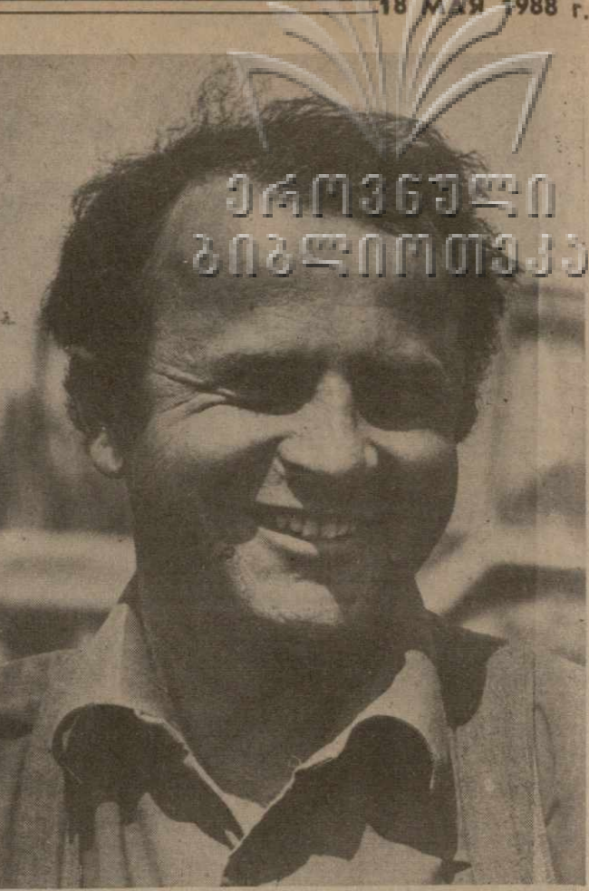
● Для того, чтобы полностью обеспечить общественное стадо кормовыми запасами, необходимо отвести под многолетние травы, сою, кукурузу на зерно и силос 220 гектаров пашни, рассчитали кормозаготовители колхоза села Октябрьский Зугдидского района.

Исходя из этого, райком партии считает необходимым приложить максимум старания в перестройке системы управ-