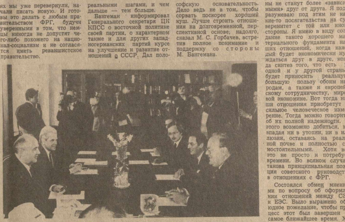
На снимке: во время беседы.