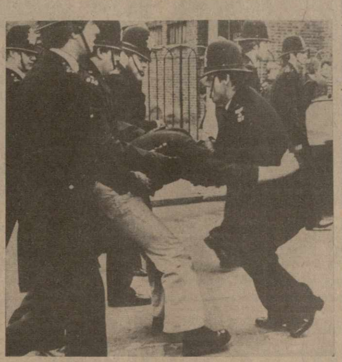
● ВЕЛИКОБРИТАНИЯ. Так британские «блестители порядка» расправляются с участниками демонстрации протеста против активизации расистских и неонацистских элементов. При разгоне демонстрации полиция произвела аресты.