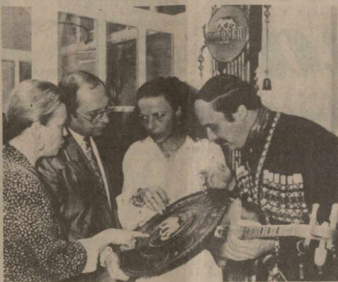
говорит тот факт, что в Вене создан клуб его имени.

Это уже не первый случай в истории партнерских связей между Грузией и Тиролем, когда Грузинская ССР представляет Советский Союз в Австрии. 10 лет назад, в 1978 году, австрийцы уже имели возможность ознакомиться с достижениями республики, колоссальным путем, проделанным ею в братской семье советских народов. В период между этими двумя событиями контакты и связи между Грузией и Тиролем постоянно развивались, охватывая все новые и новые области. Большим событием в культурной области стала, например, прошедшая в 1982 году в Вене выставка шедевров древнегрузинского искусства, а также состоявшаяся в 1984 году в Государственном музее искусств Грузии выставка, на которой были представлены экспонаты из венских музеев и хранилищ. Произведения Моцарта, Шуберта, Штрауса постоянно входят в репертуар грузинских музыкальных коллективов. С другой стороны, о популярности грузинского певца Пааты Буручладзе в Австрии