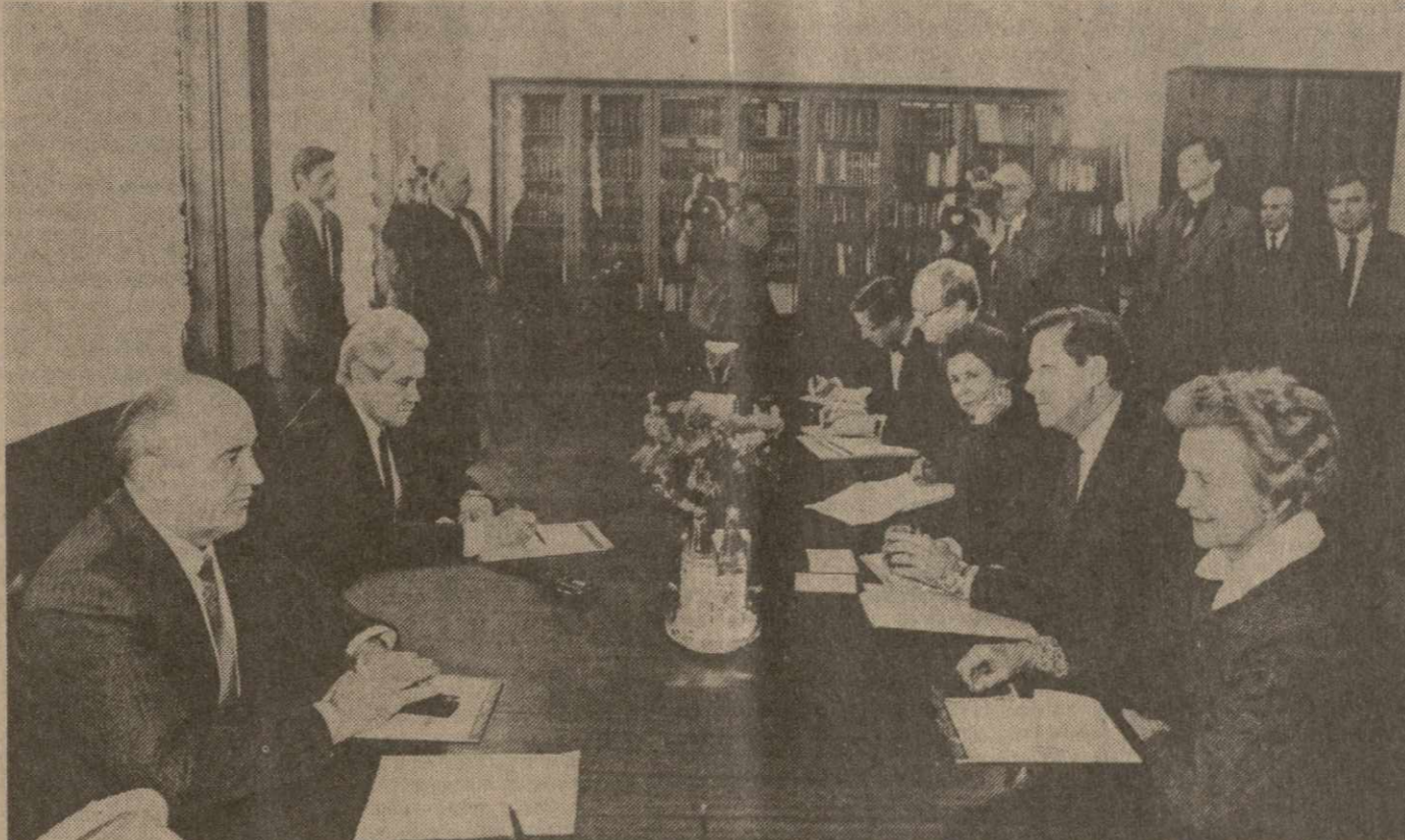
Во время беседы.

Вопрос. Изменились ли под влиянием трех встреч с президентом Рейганом Ваши представления о том, как мирное соперничество между капиталистическими и социалистическими странами следовало бы регулировать в будущем? Ответ. Я убежден, что в мире зародились и развиваются позитивные тенденции. Происходит поворот от конфронтации к сосуществованию.