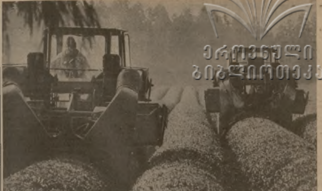
Совершенно недавно отштумела страда на плантациях Очамурзского агропромышленного комбината Кобулетского района. На старте двенадцатой пятилетки здесь было собрано 6.100 тонн сортового листа...

— Вот уже не первый год мы ставим перед администрацией вопрос о необходимости