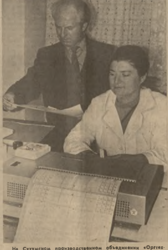
На Суземском производственном объединении «Оргтехника» широко развернуто социалистическое соревнование за выпуск продукции высокого качества.