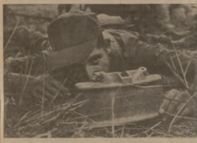
Соединенные Штаты превратили Гондурас в свой военный плацдарм в Центральной Америке, в базу военных формирований «экспедитив», сколоченных ЦРУ для вмешательства на революционном Никарагуа. На снимке: солдат гондурасской армии обучается водному делу в ходе очередных американо-гондурасских маневров.