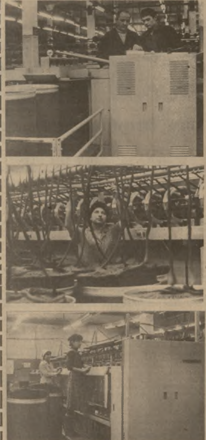
В камвольном цехе тбилисского камвольно-суконного комбината «Сабхота Сакартвело» идет техническое перевооружение. Сейчас здесь новые автоматические агрегаты, которые дадут возможность выпускать продукцию высокого качества.

Анатолий ХУГАЕВ. (Корр. «Зари Востока».)