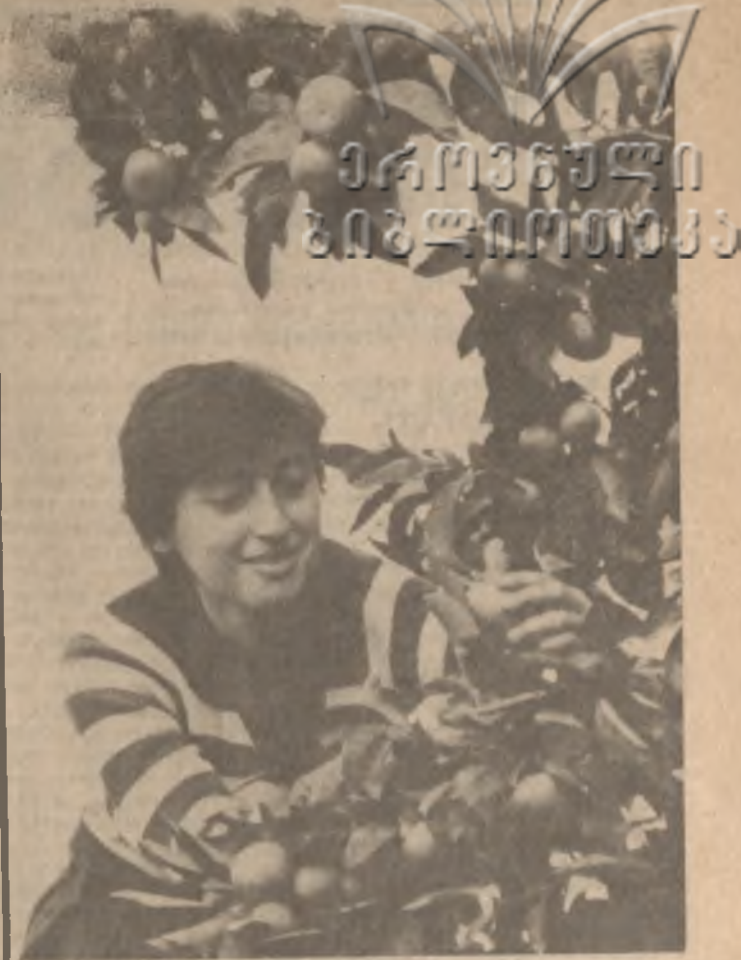
Цитрусосады колхоза села Гони Хелвачаурского района рапортовали о выполнении годового задания. Они собрали уже триста тонн мандаринов. Колхозники рассчитывают продать еще государству на январь 150 тонн оранжевых плодов. Не считаясь с нынешнего года: окончила сельскую среднюю школу, девушка избрала себе профессией возделывание цитрусосада. В эти дни она собирает по 250—300 килограммов мандаринов.