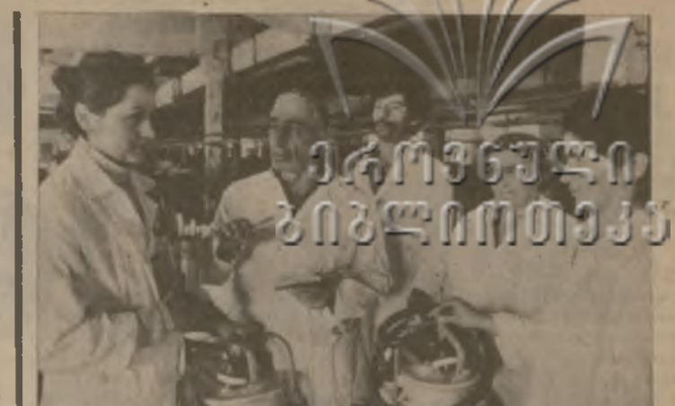
Основа успехов животноводов колхоза имени И. В. Сталина...