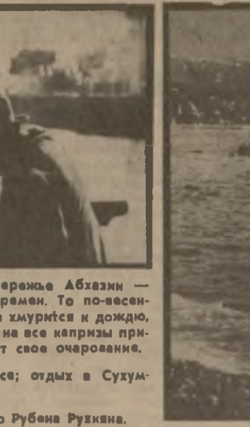
Декабрь на Черноморском побережье Абхазии — это пора разнких климатических переамен. То по-весеннему ласково греет солнце, то небо хмурится и дождю, то дует разный ветер. Но, несмотря на все капризы природы, море в любую погоду имеет свое очарование.