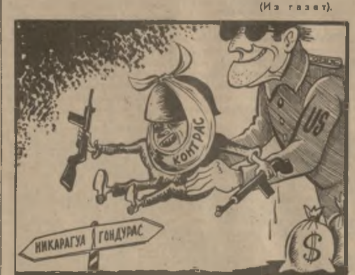
ЗЛОВЕЩИЙ АЛЬЯНС. Рис. Этери Майсурадзе.

США пытаются спровоцировать на границе Гондураса с Никарагуа вооруженный конфликт, который послужит предлогом для эскалации американской агрессии против сандинистской народной революции.