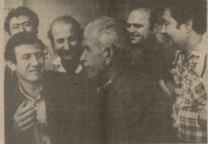
комсомола Маднеульского ГОКа, электромонтер:

Небольшое отступление. В какой-то момент показалось, что люди забыли своего делегата — разговаривали,