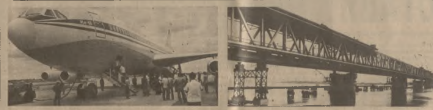
Два крыла «Влетающего дракона» — крупнейшего в Юго-Восточной Азии моста «Тханглонг» — соединяют южный и северный берега Красной реки (снимок справа).

Факты, приведенные в материале «Поликлиника в субботу и воскресенье», опубликованном в номере от 23 октября 1986 г., заслуживают самого пристального внимания.