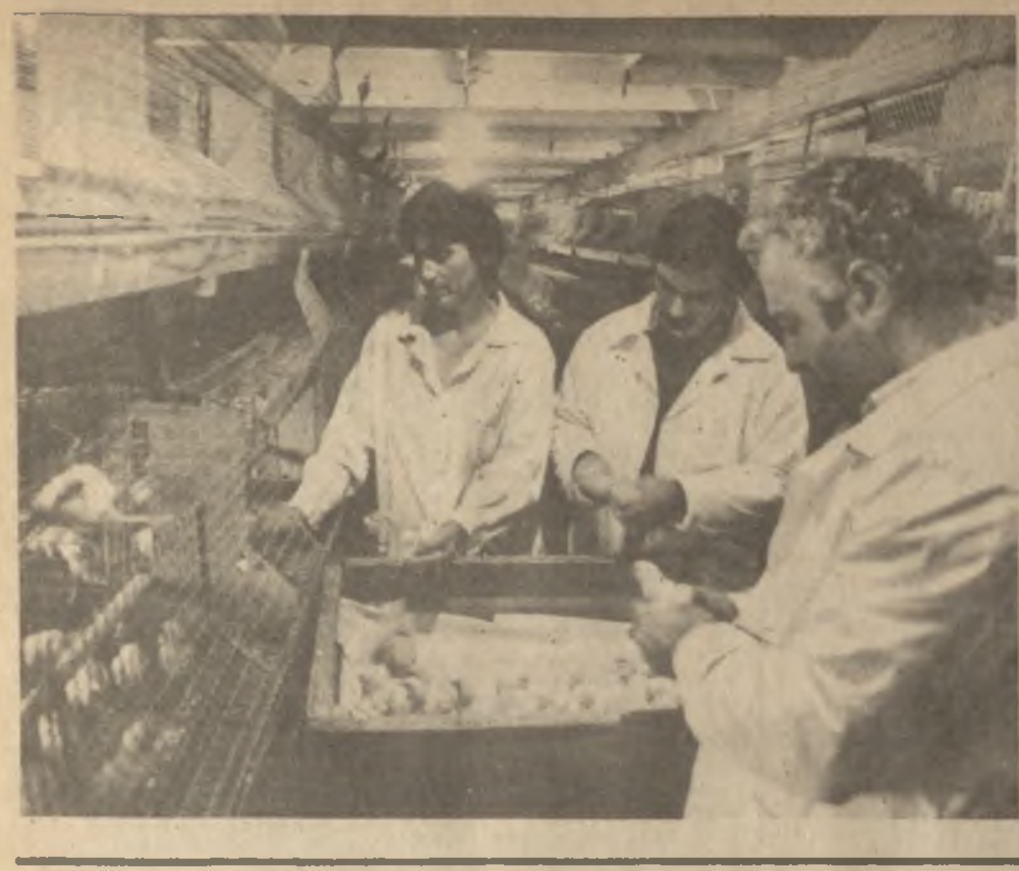
Продав государству у 2.900 тысяч штук яиц и 930 центнера в мясе, коллентиве Ланчугского межхозяйственного птицеводческого объединения за одиннадцатый месяц реализовано годовую программу. На счету птицеводов — уже десятки тысяч штук сверхплановых яиц, 180 центнера диетического мяса.