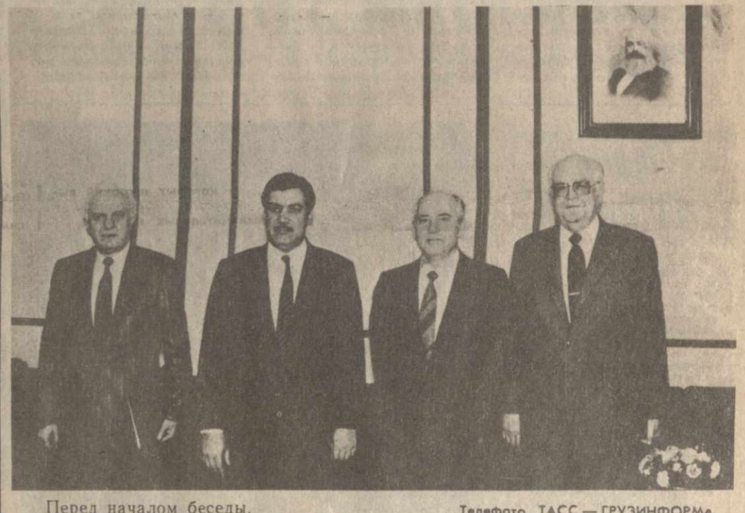
Перед началом беседы.

Во встрече участвовали Э. А. Шеварднадзе и А. Ф. Добрынин. (ТАСС).