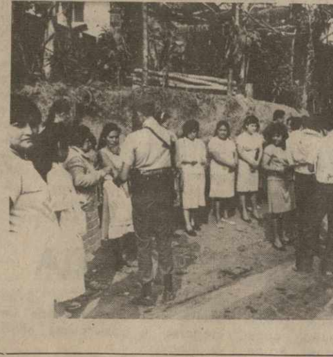
Сальвадор — одна из горячих точек нашей планеты.

Сальвадор — одна из горячих точек нашей планеты. В этой стране продолжается кровопролитная гражданская война, гибнут люди, нередко жертвами становятся дети. За прошедший месяц бойцы Фронта национального освобождения имени Фарабуно Марти (ФНОФМ) нанесли ощутимые удары по войскам режима: каратели потеряли 460 человек убитыми и ранеными, было сбито пять военных вертолетов американского производства, захвачена крупная партия оружия, боеприпасов и военного снаряжения. На поражения в бой с партизанами подразделения сальвадорской армии и полиции, а также ультраправые террористические банды отвечают новой волной убийств и репрессий против гражданского населения. Как указали руководители ФНОФМ, очередная вспышка террора и насилия является попыткой марionеточного кабинета Дуарте предотвратить общенациональное восстание, возможность которого становится все более реальной. На снимке: подобные сцены стали повседневными в Сальвадоре — в поисках партизан проводятся повальные обыски и проверки документов на дорогах. Фото Пренса Латина — ТАСС.