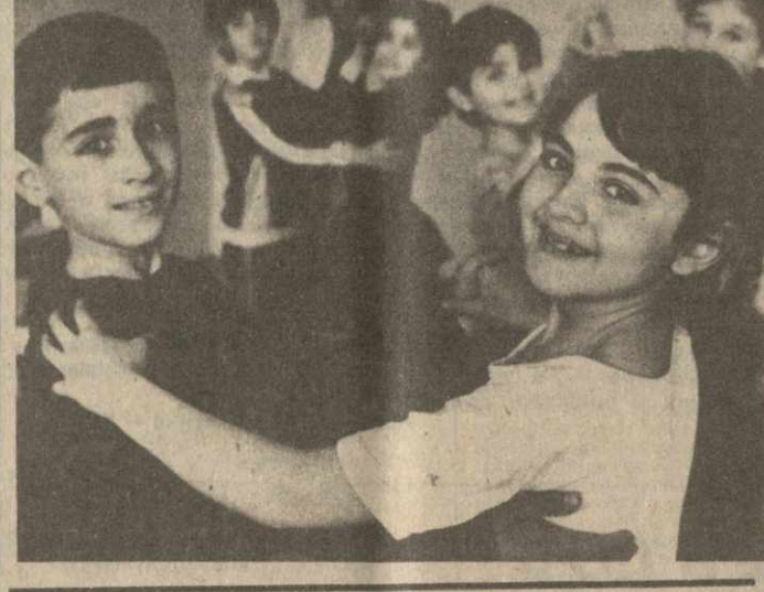
На снимках: здание культурного центра; в классе балных танцев.