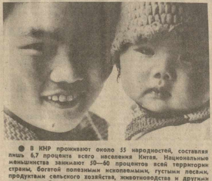
В КНР проживают около 55 национальностей, составляя лишь 6,7 процента всего населения Китая. Национальные меньшинства занимают 50-60 процентов всей территории страны, богатой полезными ископаемыми, густыми лесами, продуктами сельского хозяйства, животноводства и другими ресурсами. За многовековую историю Китая национальные меньшинства совместно с ханьцами, которых более 936 миллионов, создали материальную и духовную культуру китайской нации, общими усилиями основали Китайскую Народную Республику, внесли и вносят свой вклад в строительство новой жизни. На снимке: представительница народности туцзя со своим сыном. Они живут в провинции Гуйчжоу.