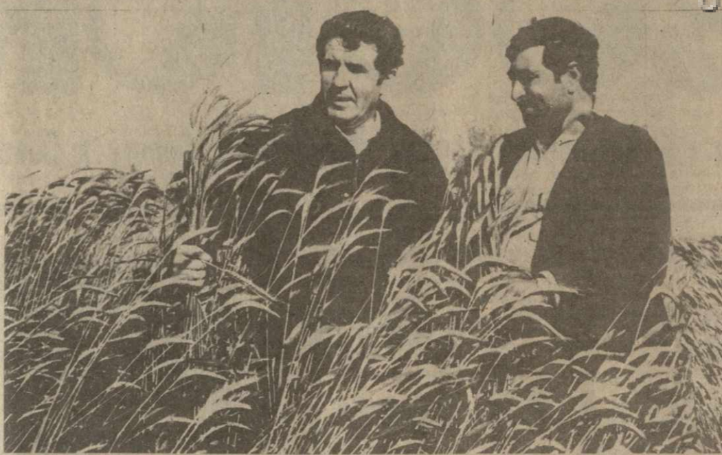
Успешно идет заготовка кормов в Димандарском животноводческом комплексе Гардабанского района. Кормодобытчики хозяйства, встав на трудовую ваху в честь XIX Всесоюзной партийной конференции, стремятся максимально использовать каждый погожий день, заложить прочную основу для дальнейшего развития отрасли.

ро имеется в политической системе, подлежащей перестройке. Создание в настоящее время принципиально новой антизатратной экономической системы, основанной на самоуправлении, самоорганизации и самофинансировании в полной мере не может быть осуществлено при сохранении распределения средств производства через Госнаб без реформы цен, без широкого внедрения оплаты по конечным результатам работы по подрядной системе на основе разветвленной сети полного хозяйственного расчета. Необходимо всемерно ускорять этот процесс. Однако чрезвычайная успешность в этом деле также вредна. В тезисах широко освещается вопрос о радикальном повышении роли Советов депутатов трудящихся. Функции Советов в основном определены социальными аспектами, что оправдано в современных условиях, когда производством управляют министерства и ведомства. Однако ведомственные перегородки, необходимость согласования порой простых вопросов пледит бюрократизм. От-