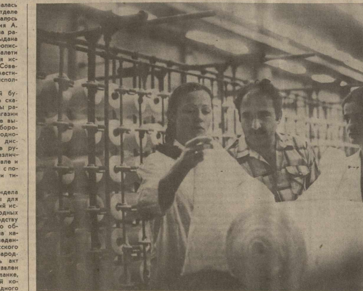
Главной заботой народных контролеров вязальной фабрики производственного объединения «Гдань» стал выпуск продукции высокого качества. В последние месяцы во всех цехах дозорными проводятся рейды, вместе с представителями администрации изучаются причины брака, идет поиск решений, способных кардинально повлиять на качество изделий.