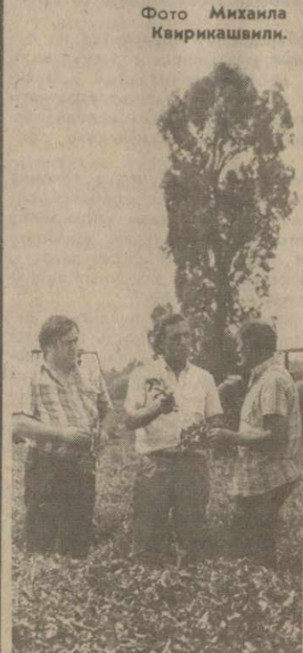
Сделав ставку на качество, ведут сбор урожая-88 труженники зеленых плантаций Цецхлаурского чаеводческого совхоза Кобулетского района — одного из крупнейших субтропических хозяйств Аджарии.