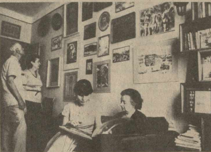
На снимках: фотографии из экспозиции Музея Нодара Думбадзе; супруга и соратник писателя Нанули Петровна готовят к приходу первых посетителей, а этому сопутствовали многие недели кропотливой работы — ведь необходимо было систематизировать множество документов, материалов, касающихся жизни и творчества писателя, привести в порядок архив.

Перед нами портрет Нодара Думбадзе, исполненный Александром Бендзеледзе. Художник точно уловил настроение писателя, — он думает, размышляет о будущих произведениях. Но вот что интересно — рядом висит множество