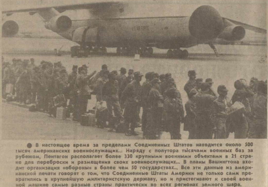
На снимке: американские солдаты прибыли в ФРГ...

В настоящее время за пределами Соединенных Штатов находится около 500 тысяч американских военнослужащих... Наряду с полутора тысячами военных баз за рубежом, Пентагон располагает более 330 крупными военными объектами в 21 стране для переоборудования и размещения своих военнослужащих... В планы Вашингтона входит организация «обороны» в более чем 50 государствах... Все эти данные из американской печати говорят о том, что Соединенные Штаты Америки не только сами превратились в крупнейшую милитаристскую державу, но и пристегивают к своей военной машине самые разные страны практически во всех регионах земного шара.