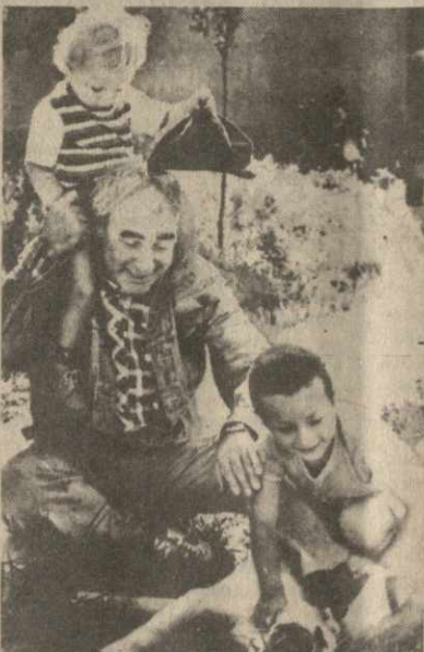
фотографий, где запечатлен писатель с друзьями и коллегами, и везде те же самые глаза, в которых видна напряженная работа мысли.