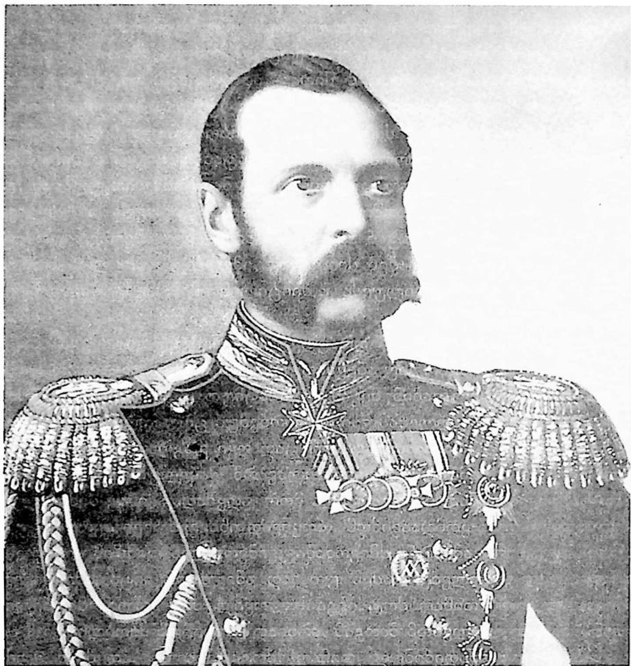
ალექსანდრ II (1855-1881) ალექსანდრ II (1855-1881)