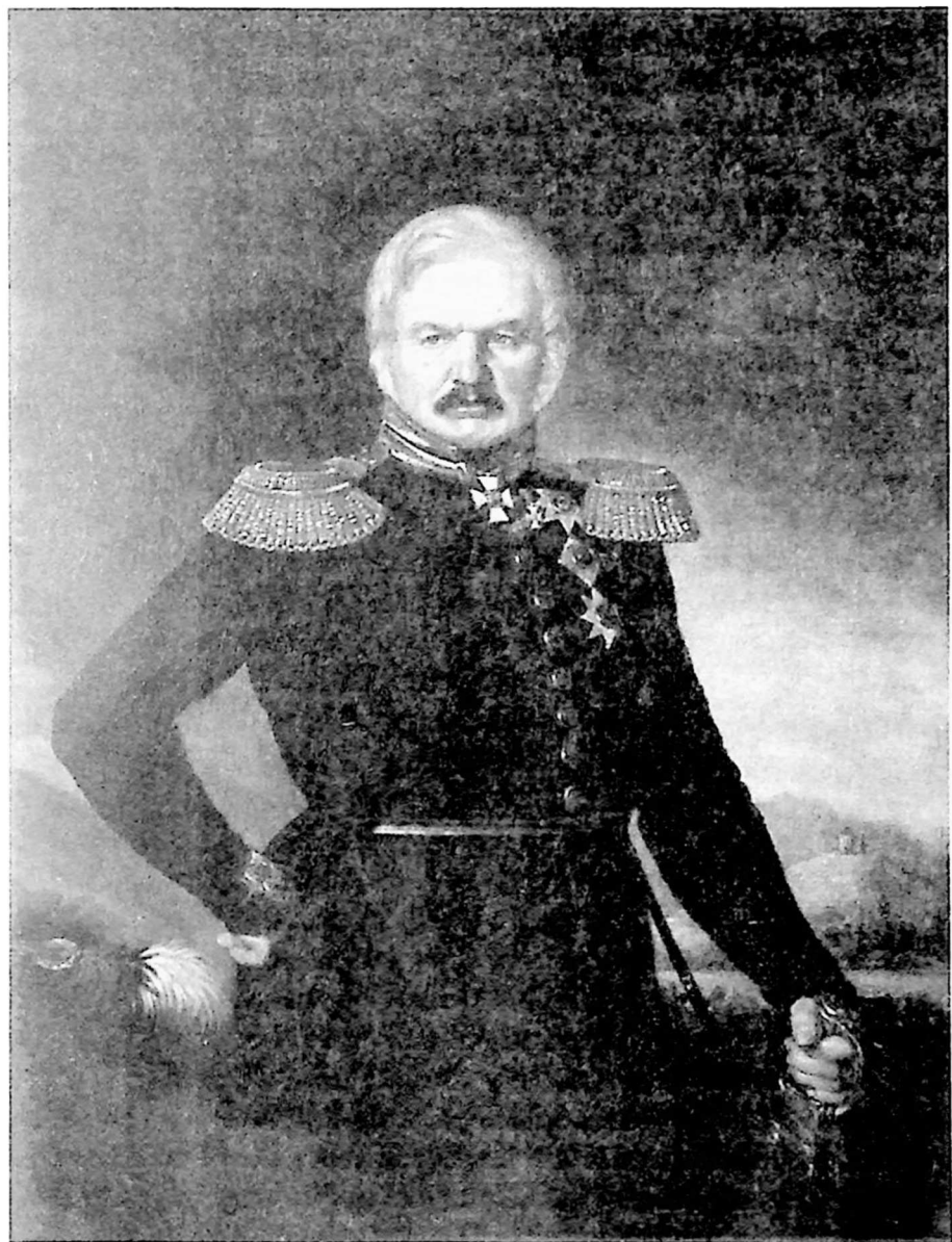
ალექსეი ერმოლოვი (1816-1827)