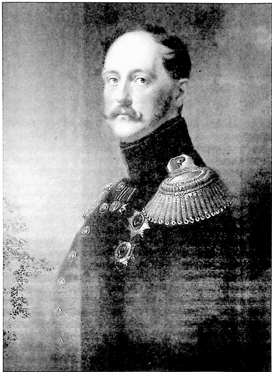
ნიკოლაი I (1825-1855)