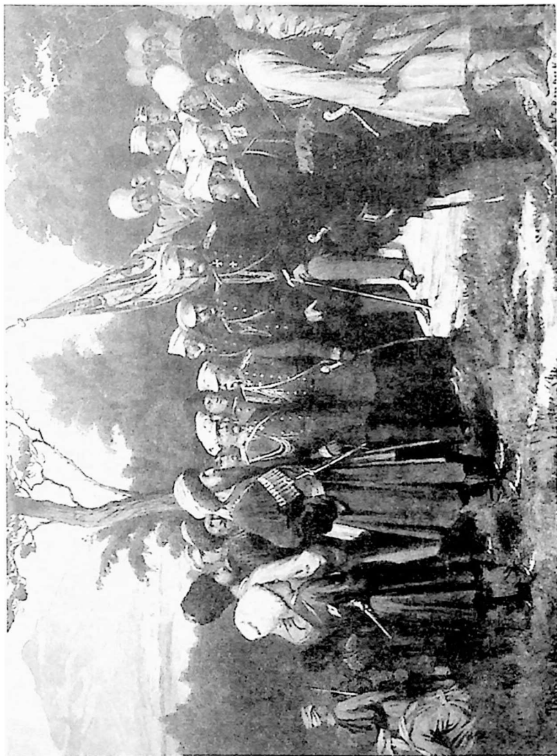
შამილის შეხვედრა ალექსანდრ ბარიატინსკისთან (1859 წლის 25 აგვისტო). ა.დ. კოპენკოს ნახატი (1880 წ.)