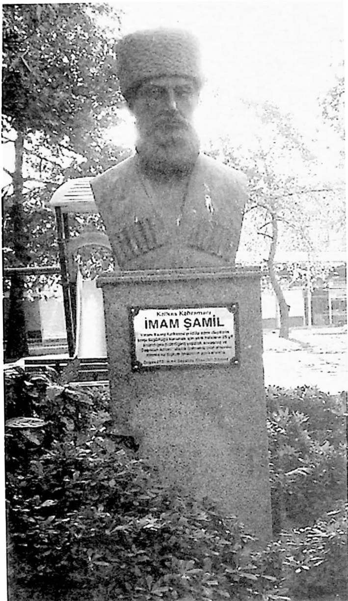
შამილი ბიუსტი თურქეთში ქ. იალოვაში