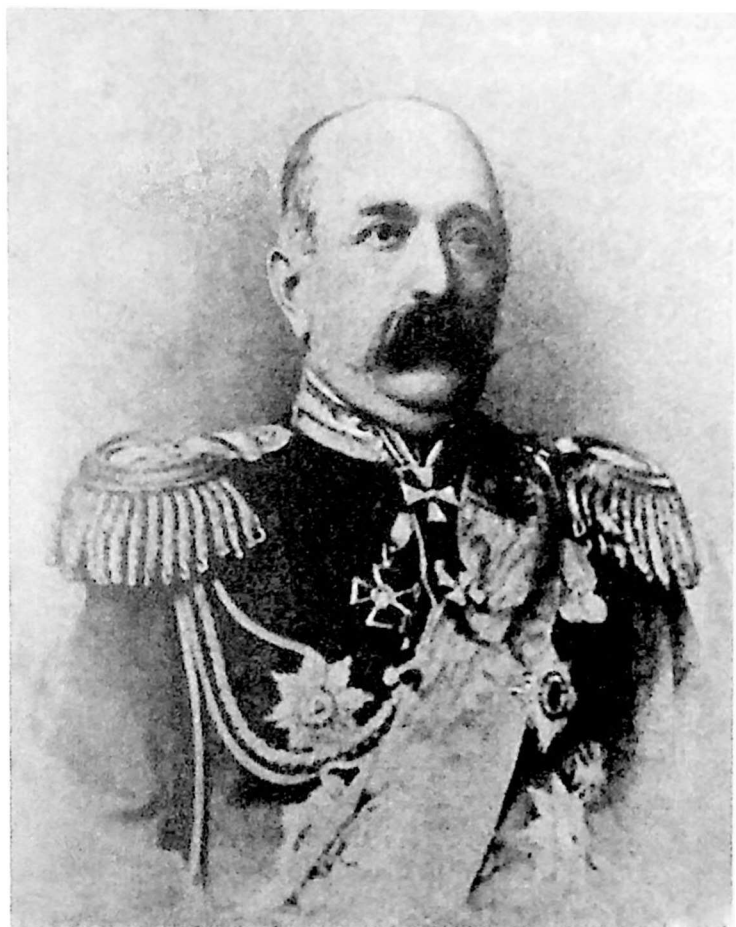
Генералъ-адъютантъ князь Іосифъ Давыдовичъ ТАРХАНЪ-МОУРАВОВЪ.