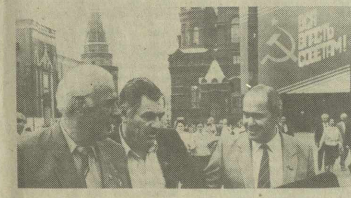
На снимках: народные депутаты из Грузинской ССР после вечернего заседания на Красной площади; народные депутаты Грузинской ССР В. Коберидзе, Г. Метохидзе и А. Чехоев.