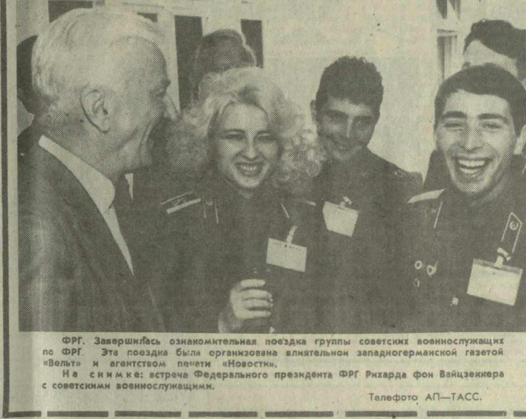
ФРГ. Завершившая ознакомительную поездку группы советских военнослужащих по ФРГ. Эта поездка была организована влиятельной западногерманской газетой «Вельт» и агентством печати «Новостки».

В последние время в печати и телевизионных передачах, в научных кругах, а также среди населения идет дискуссия и обмен мнениями относительно так называемого «биополя». Какие только биологически редкие явления не объясняют при помощи «биополя». Тут теплоты и телекинез, рудонка-