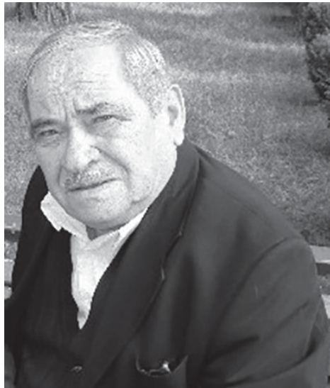
სად არის სიტყვა, თვალის ამხელი და დამალული აზრის მპოვნელი?!

უამრავია ამოსახსნელი კითხვა, რომელიც ახსნას მოელის,