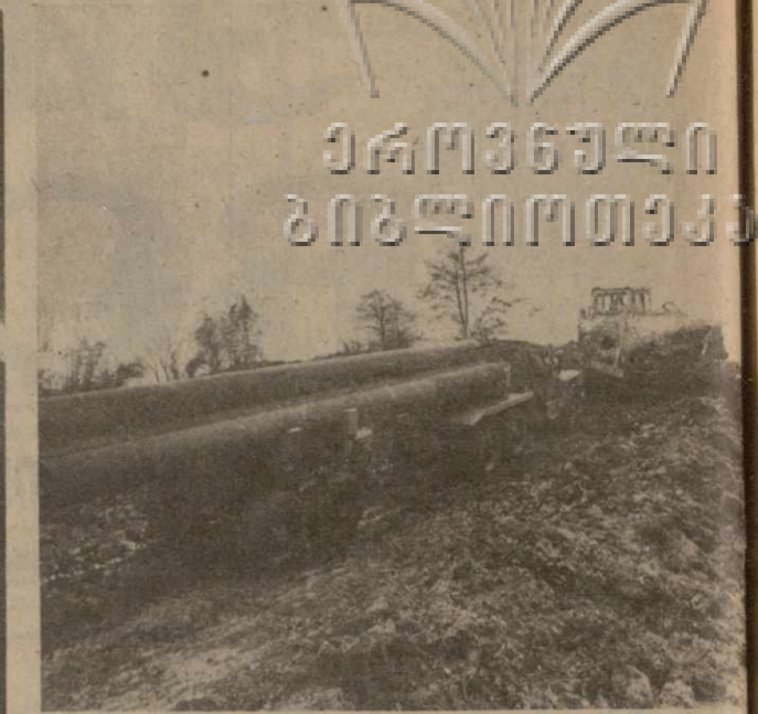
Идут работы по переводу Тварчельского ГРЭС на газозапасное топливо, что позволит коренным образом улучшить экологию региона в непосредственной близости от портов и здравниц Абхазии. Уже построены газораспределительная станция, эстакада для газопровода, полностью завершена реконструкция котла № 3 и т. д.

Тварчельским специалистам оказывают помощь в монтажных работах харьковский трест «Энергопроект», тбилиское управление «Кавказэнергомонт», оборудование идет из Ташкента и Минска.