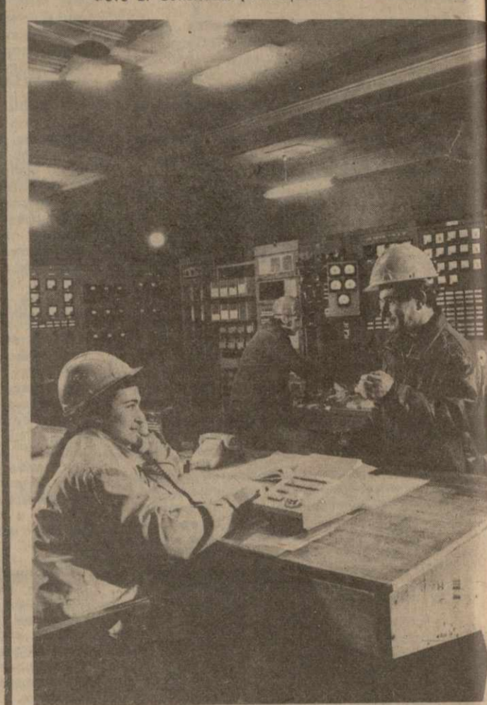
Беседу вел Вахтанг АХАЛАЯ.