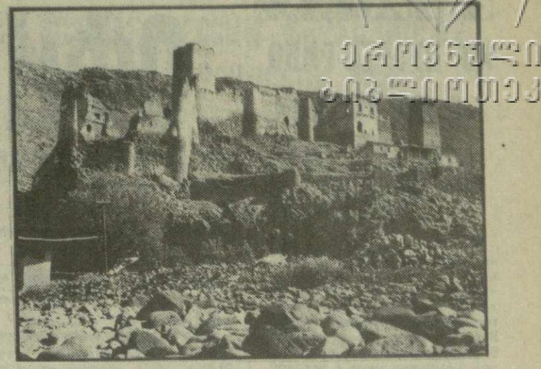
Аспиндза: вчера, сегодня, завтра

В последние годы благодаря помощи руководства республики проводятся серьезные мероприятия по ускорению социально-экономического развития района. В результате за десять лет на