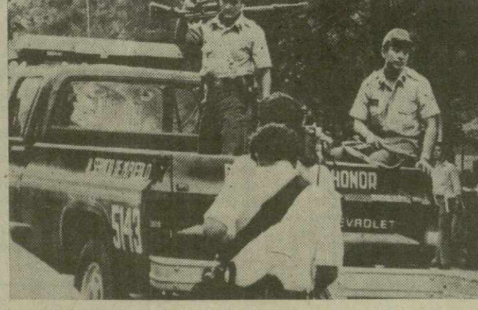
Сальвадор. На снимке: вооруженные солдаты на улицах городов и поселков страны стали повседневным явлением.