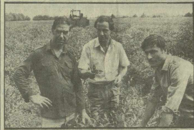
Тридцать два дня не работали многие хозяйства Очамчирского района. Убытки от забастовок исчисляются миллионами рублей.

Нугзар КИМКЛАДЗЕ. (Корр. «Заря Востока».)