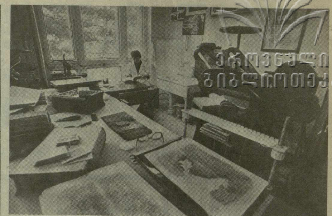
Бесценные сокровища, созданные трудом и гением многих поколений грузинского народа, хранятся в Институте рукописей имени Корнелия Кекелидзе Академии наук Грузии. В фондах этого уникального хранилища духовного наследия народа собраны бесценные памятники грузинской литературы, истории, философии, правового дела, многообразие которых и определяет научный профиль института. Его коллектив ведет большую научно-исследовательскую работу по изучению и систематизации фондов, научному описанию и составлению исторических документов, каталогов рукописных книг и грузинских рукописей, хранящихся в зарубежных культурных центрах, личных архивных материалов. На снимках: в переплетной мастерской института; в отделе охраны, учета и экспозиции.

— К сожалению, многие не поняли главного: программа «Здоровье» — забота не только медиков. Она призвана в комплексе решить вопросы, включающие улучшение условий труда и быта, совершенствование медицинского обслуживания и санитарно-гигиенического состояния предприятий отрасли, культуру, воспитательные и спортивные — оздоровительные мероприятия. Вот мы привыкли к парадной физкультуре, а для массового здоровья людей ведь важнее физпаузы, производственная гимнастика... Наша отрасль характеризуется низким уровнем социаль-