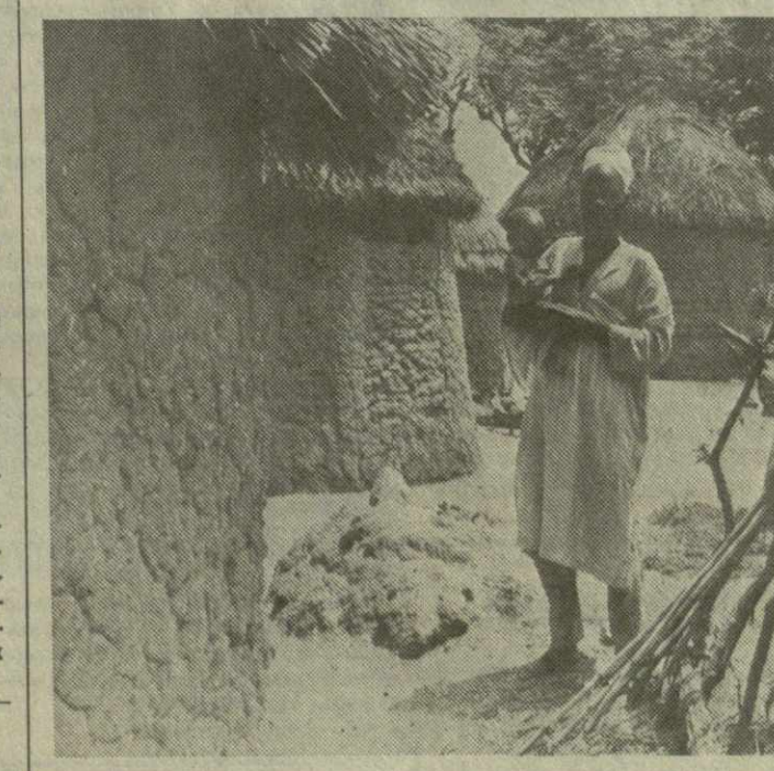
Быт среднестатистического нигерийского жителя сельской местности мало в чем изменился за последние десятилетия. Во многих деревнях можно увидеть глиняные хижинки с соломенными крышами, знакомыми еще по иллюстрациям из учебников истории. В жилищах крестьян нет света, водопровода и других удобств. Да и труд самих крестьян тяжел, всему этому есть свои причины.

На снимке: типичная деревушка в Центральной Нигерии недалеко от Баучи.