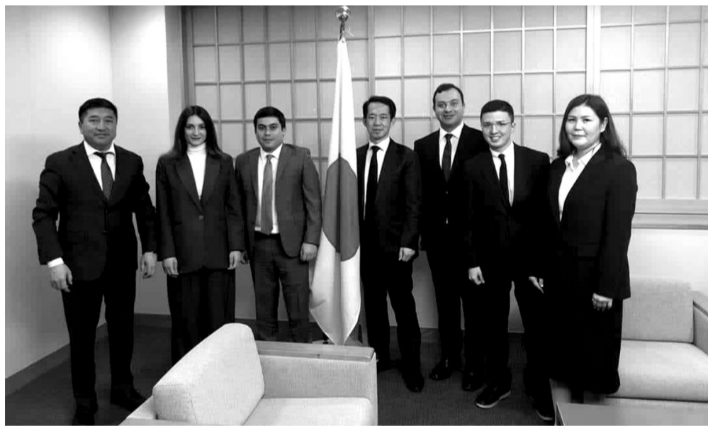
იაპონიის საგარეო საქმეთა სამინისტრო

-ეს იყო ძალიან მცირე ცოდნა, თუმცა, ჩემი მასწავლებლისგან ყოველთვის