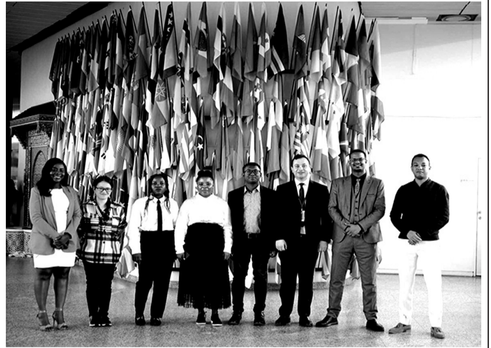
ატომური ენერჯის საერთაშორისო ორგანიზაციის შტაბ-ბინა.

ექსკურსია და ჩართულობა ექსპერიმენტებში. ამ დროს უკვე მაგისტრატურის სტუდენტი ვარ. ამ ვიზიტს უკვე მეორე ვიზიტი მოჰყვა, ისევ შვეიცარიაში პოლ შერერის