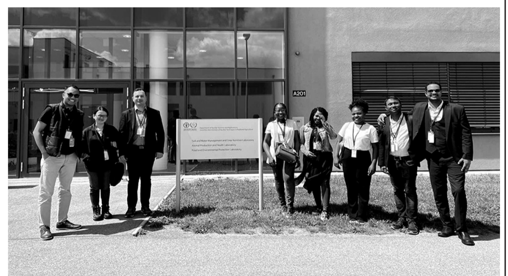
-ატომური ენერჯის საერთაშორისო ორგანიზაციის კვლევითი ცენტრი.