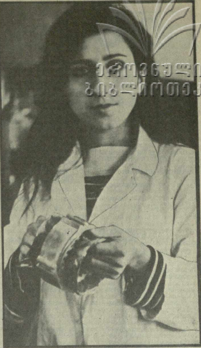
Что самое главное в холодильнике Илк в вентиляторе! Конечно, скажете вы, мотор. И будете правы, ибо он — «сердце» любого бытового агрегата. Потому этим узлам на производстве уделяется особо пристальное внимание. Двигатели стремятся сделать надежными и долговечными. Именно на это направлены усилия участка сборки электродвигателей производственного объединения «Грузэлпромаш».