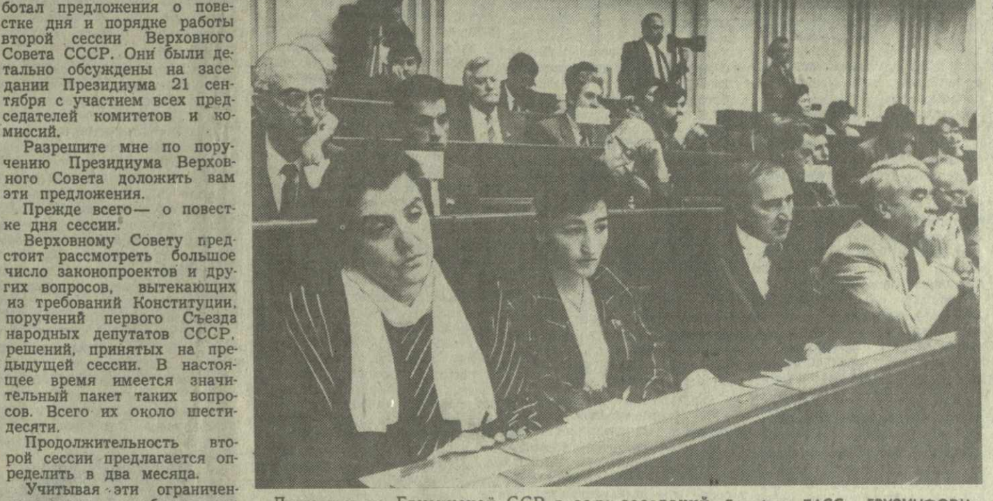
Депутаты из Грузинской ССР в зале заседаний.