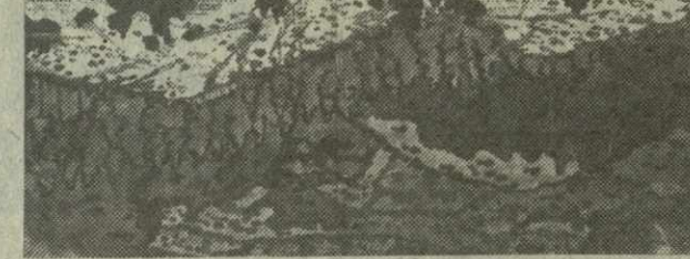
На снимках: репродукции картин Д. Какабадзе.