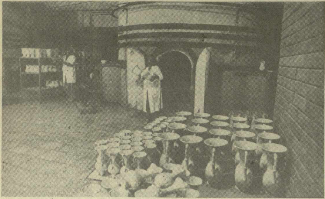
Договор о сотрудничестве с западногерманской фирмой «Бохак», заключенный Тбилиским комбинатом стройматериалов, предусматривает поставку пользующихся большим спросом за рубежом изделий ручной работы — декоративных кувшинов и ваз из красной глины.