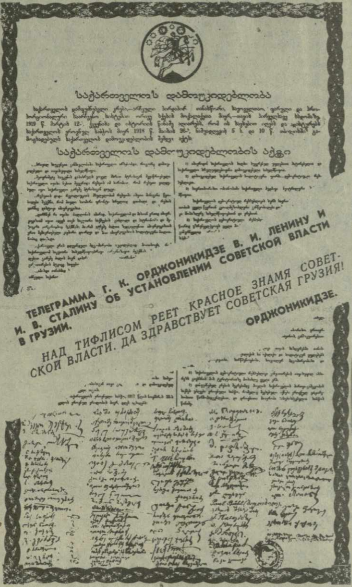
Газета «Кавказская коммуна» (Баку), 27 февраля 1921 года

ТИФЛИС. Почти все руководящий персонал всех государственных учреждений меньшевиками вывезен. Технический персонал остался в размере 50%. Отдельные группы техников и специалистов являлись в Ревком с предложением своих услуг. На местах остался весь преподавательский персонал учебных заведений, большинство артистического мира и медицинский персонал. ...Тифлис. В ночь на 24 февраля меньшевики начали отход из Тифлиса, не предупредив другие партии правительства и членов Учредительного собрания. ...Тифлис. Наши части имели столкновения только у Мцхета, дальше сопркосновения с противником не было. Народогардейцы отступают форсированным маршем, терзая арьергарды. ...Тифлис. Все время с мест поступают в Ревком поздравительные телеграммы от рабочих Грузии. Заводы продолжают работать, завтра будет выдшен первый перевоз.