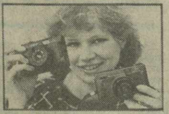
портрируется более чем в 60 стран, в том числе в Англию, ФРГ, Канаду, Индию.

ЛЕНИНГРАД. Более чем на 30 миллионов рублей продукция мирового назначения, в значительной мере благодаря конверсии, стало выпускать Ленинградское оптико-механическое объединение (ЛОМО). В минувшем году в среднем на 13 процентов увеличился выпуск промышленной и научной аппаратуры: микроскопов, медтехники, оборудования для телевидения.