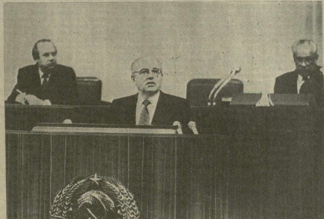
На снимке: во время выступления.

Уважаемые товарищи! Работа нашего Съезда подошла к концу? Что нам удалось сделать за 12 до предела уплотненных декабрьских дней — об этом будут еще много говорить и спорить и у нас в стране, и за рубежом. И все же, думаю, мы вправе уже сейчас сделать несколько выводов. Прежде всего второй Съезд народных депутатов СССР, продолжая и развивая линию первого Съезда, подтвердил курс на перестройку, радикальную реконструкцию всего нашего общественного здания на основе сохранения и обогащения социалистических ценностей. Если говорить коротко, то мы — за демократический гуманный социализм, вбирающий в себя весь отечественный опыт и опирающийся вместе с тем на все прогрессивные достижения современной цивилизации. И еще один, как мне кажется, основополагающий вывод из работы Съезда. Это — требование быстрее и решительнее продвигать по пути реформ в экономике и политике, в духовной сфере, в строительстве правового государства и развитии нашей федерации. Здесь, пожалуй, и был центральнейшей задачей разрабатываемой на Съезде дискуссии. Это спор не о том, нужно или нет проводить революцию и реформы, — общество высказалось на этот счет определенно. Это, в сущности, спор о том, нужно ли двигаться без оглядки, методом своего рода скачков, либо соизмерять каждый шаг с реальными возможностями страны, настроением народ-