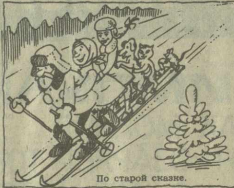
По старой сказке.