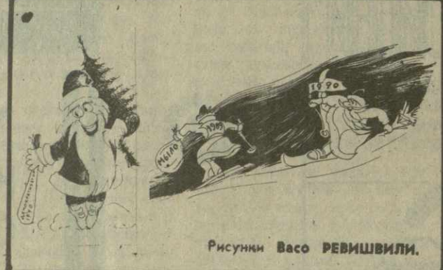
Рисунки Васо РЕВИШВИЛИ.