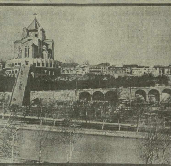
будет не только с определением проекта-победителя, но и с его осуществлением. Ведь, как известно, возведение грузинских церквей практически не осуществлялось в течение двух последних веков. Исключение составляет лишь Кашветский храм в Тбилиси, возведенный в начале нынешнего столетия по аналогии с памятником XI века — Самтавским.