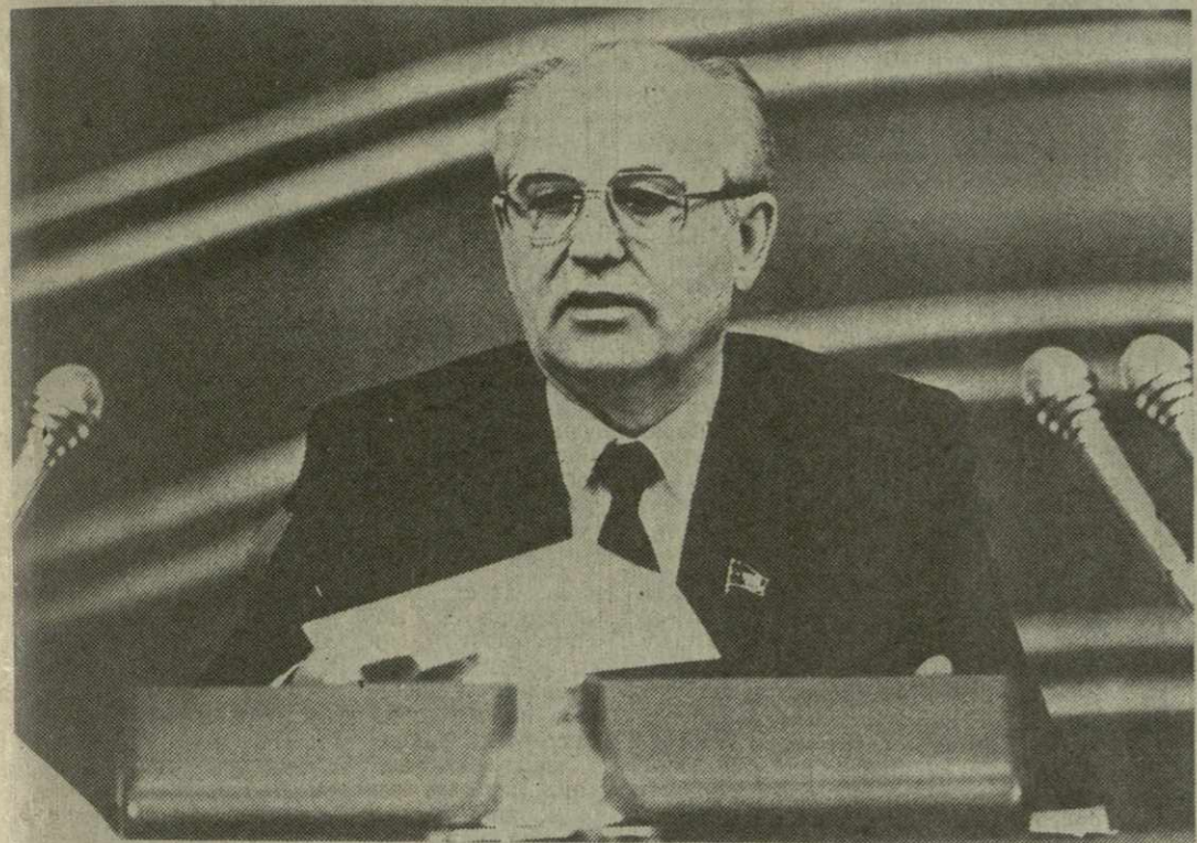
12 марта в Кремле начал работу внеочередной третий Съезд народных депутатов СССР. Съезд открыл Председатель Верховного Совета СССР М. С. Горбачев. На снимке: во время открытия Съезда.