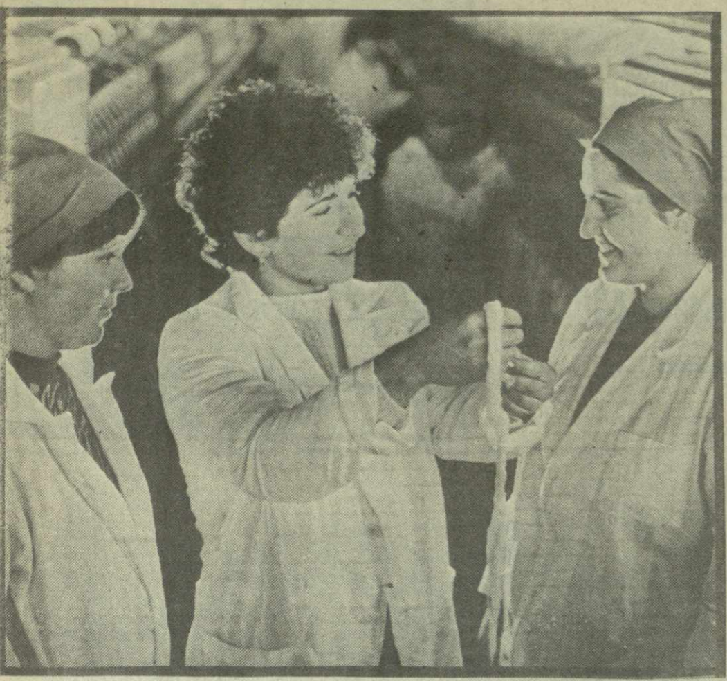
Стабильно работает коллектив Сачхерского хлопчаточесного комбината, где трудятся квалифицированные рабочие, в основном выпускники здешнего текстильного училища. Вот уже два года они готовят специалистов для своего базового предприятия. Тысячи молодых рабочих различных профес-