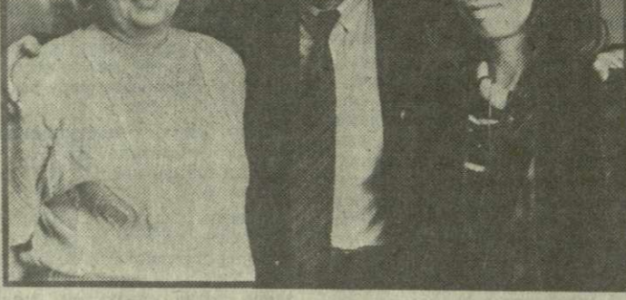
Факт крупным планом

На Надежду можно молиться, как на икону. И ждать, наблюдая из далекого далека — Парижа, Нью-Йорка. Кто осудит? Но он создает Международную ассоциацию — летом