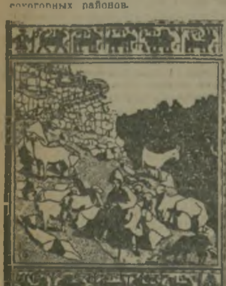
Иллюстрация худ. Шарбашина и поэма Ов. Туманяна «Ануш».