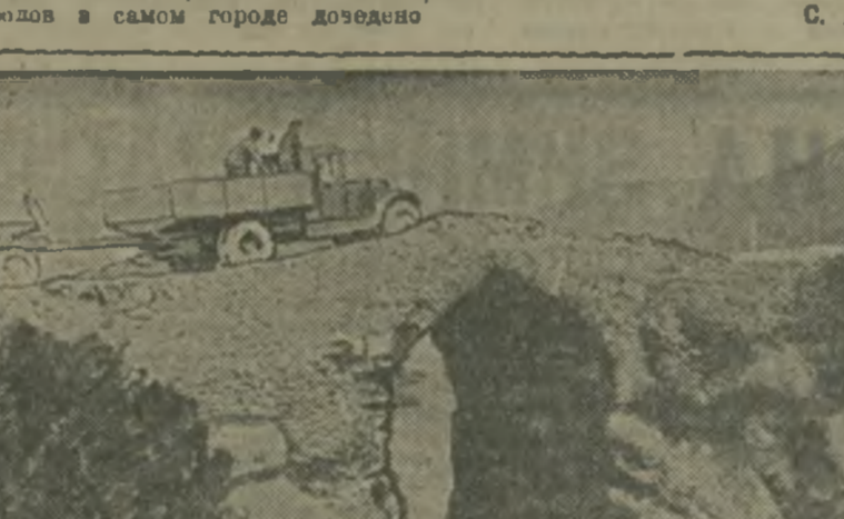
Старинный мост через реку Тертер. Недалеко от моста расположена строительная площадка ТертерЗС. (Фото Полякова).

Восемьсот миллионов кубометров воды поет Тертер ежегодно. С отрогов Мре-Дага, где берет река свое начало, впадает в Вору великая бессовязно такия воды Тертера.