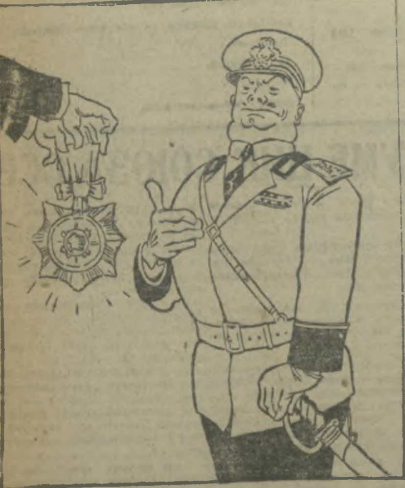
Рис. И. ГУРРО.