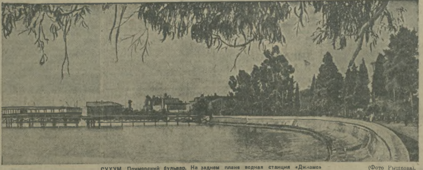
СУХУМ, Приморский бульвар. На заднем плане водная станция «Диалма».

Министерство культуры и просвещения Грузии в 1937 г. выпустило по инициативе Министра культуры, искусства и просвещения Грузии, в помощь трудящимся Донгуз-оруна.