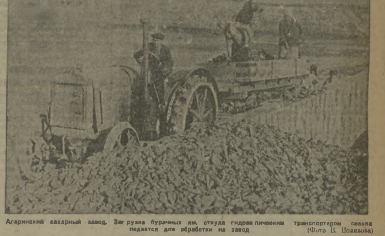
Агаринский сахарный завод. Загружен бурячных им. отсюда гидравлическим транспортером свеклы подается для обработки на завод