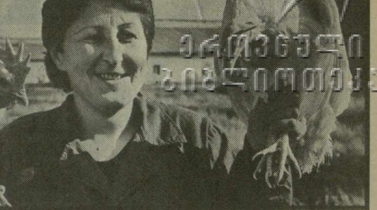
На снимке: одна из лучших птичниц Цезаря Метрели.