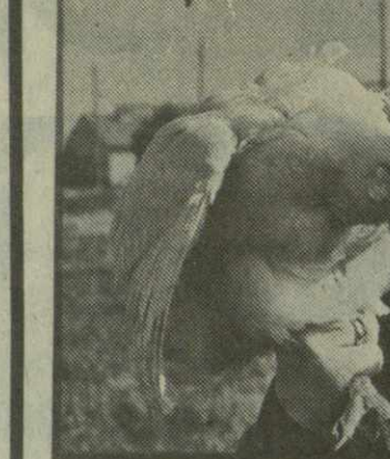
700 тысяч голов содержится на Сагареджской птицеводческой фабрике, 270 тысяч из них — несущие. Трудовой коллектив фабрики намерен добиться большей отдачи предприятия.