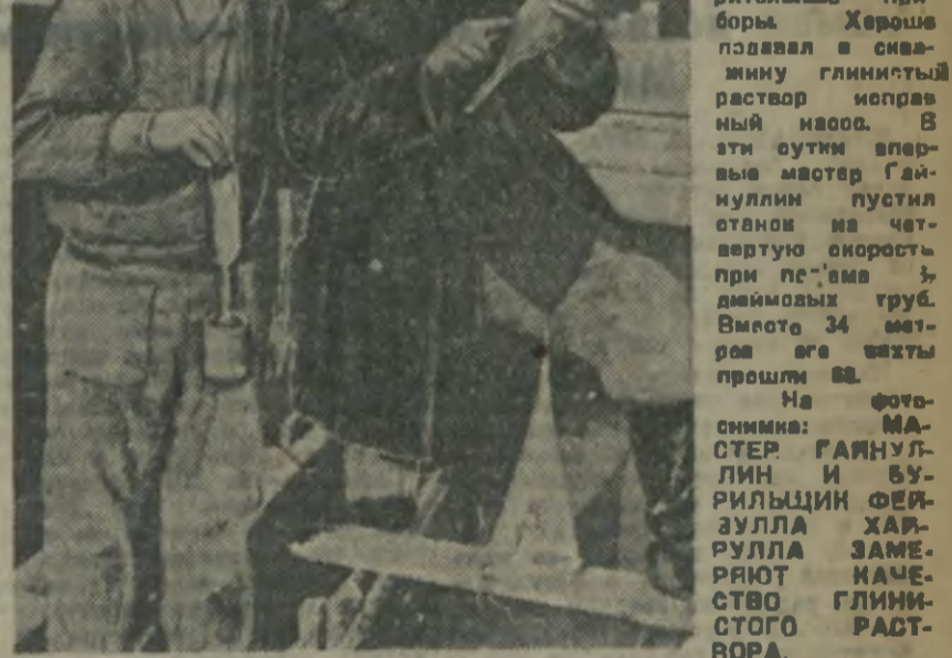
4 Там эти сутки шлились не-... работы в шахтах...