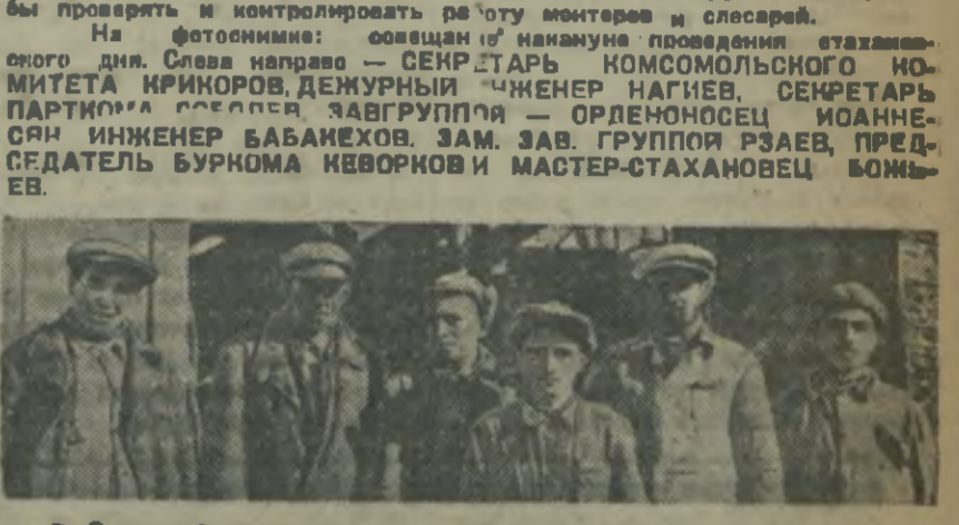
2 Огромный подъем, в котором колл-... работы в шахтах...