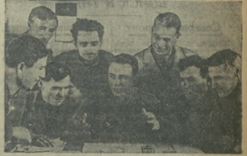
1 Премия, чем провести стаче... работы в шахтах...