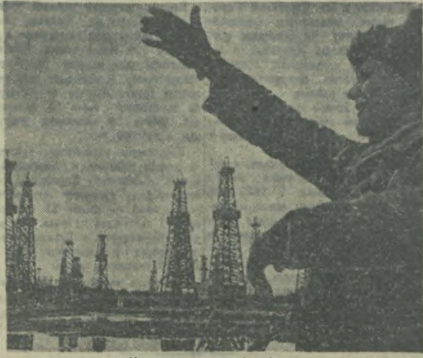
На промысле им. Азадннова