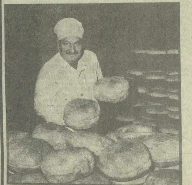
Почта «ЗВ» подсказало: