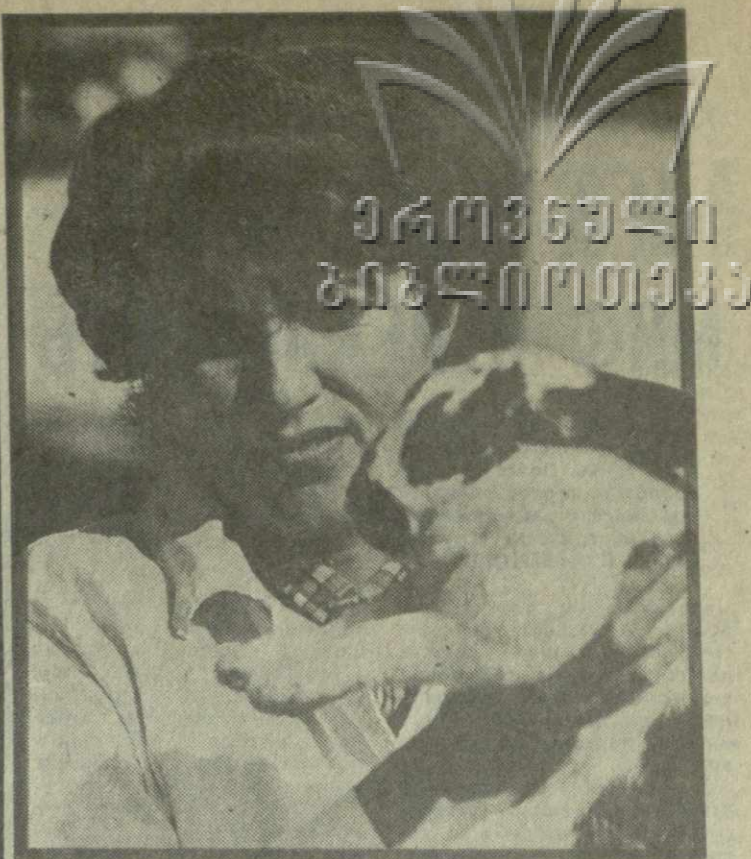
Каждый год растут потребности на продукцию Зестафонского кролиководческого совхоза. Чтобы полнее удовлетворить запросы на диетическое мясо, в хозяйство решили внедрить аренный подрадь.

საბჭოთავო საბჭოთავო საბჭოთავო საბჭოთავო საბჭოთავო