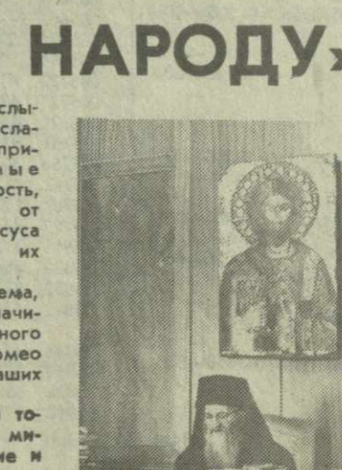
На снимке: 75-летний глава Вселенской Константинопольской патриархии Димитриос I.

Мы желаем всем, кто слышит или прочитает это послание, с радостью отметить приближающиеся пасхальные празднества. Пусть радость, освящение, свет и мир от воскресения нашего Иисуса будет всегда с нами и их семьями. После окончания приема, через несколько минут началось заседание Священного синода, но отец Бартоломео успел ответить на два наших вопроса. — Что необходимо для того, чтобы в христианском мире воцарилась все согласие и спокойствие? — Любить друг друга, осознавая роль и значение церкви, ее высокую ответственную миссию. Христианство выступает против любого вида насилия и террора, предлагает все возникающие проблемы решать путем диалога, мирными средствами. И братские церкви должны подавать пример такого диалога. — Приближаются пасхальные дни. В Грузии, наряду с родными и близкими, будут помнить и невинно погибших в Тбилиси 9 апреля прошлого года. Наверное, и ваши молитвы тоже будут обращены к ним! — Люди, погибшие за высокие идеалы, мир, любовь, свободу, равенство, справедливость, принесли себя в жертву не только ради своего народа, но и всего человечества. Поэтому, естественно, что мы, все верующие братья, будем молиться за их память. Фонд призвал все ведомства и учреждения, предприятия и организации, общественные объединения, Грузинскую православную церковь, всех людей доброй воли, все общество в дни Недели организовать и принять активное участие в благотворительных мероприятиях, практическими делами помочь тем, кто нуждается в заботе, поддержке и покровительстве.