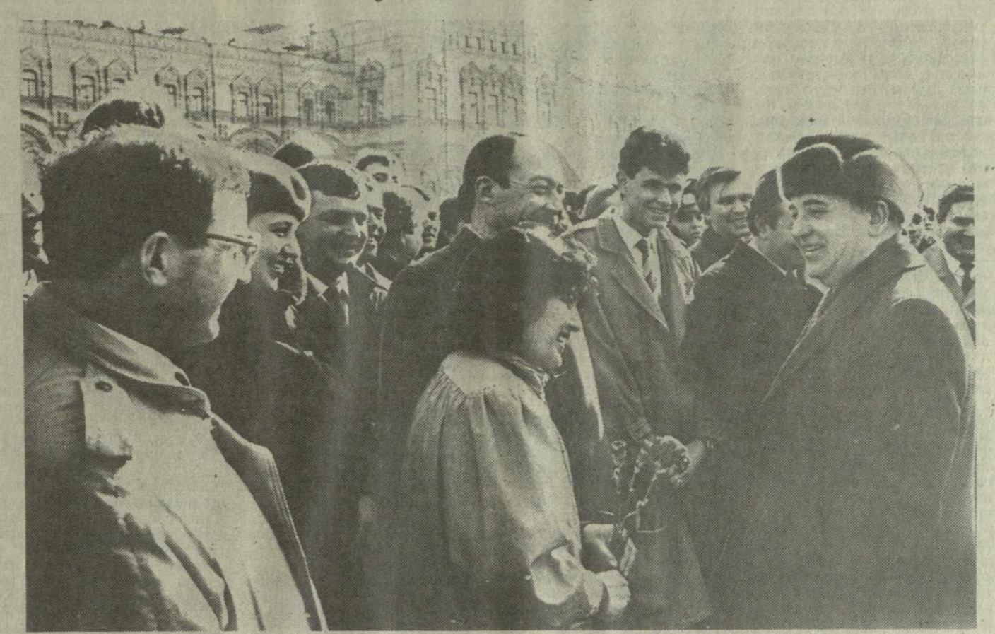
Президент СССР, Генеральный секретарь ЦК КПСС М. С. Горбачев с делегатами XXI съезда ВЛКСМ на Красной площади.

10 апреля после выступления перед делегатами XXI съезда ВЛКСМ М. С. Горбачев ответил на заданные ему многочисленные вопросы.