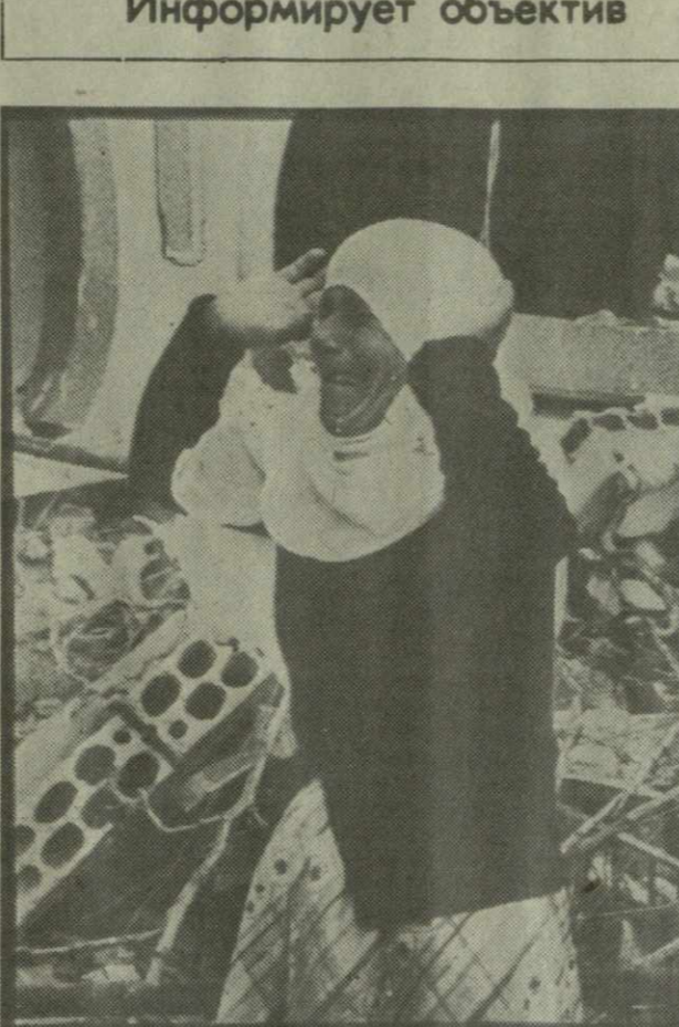
Ливан многострадальный... Среди руин Бейрута бродят обездоленные, лишенные крова люди. Варварские артиллерийские обстрелы, танки на улицах. Среди мирного населения имеются убитые и раненые. На снимке: у этой женщины, обезумевшей от горя, разрушили дом.