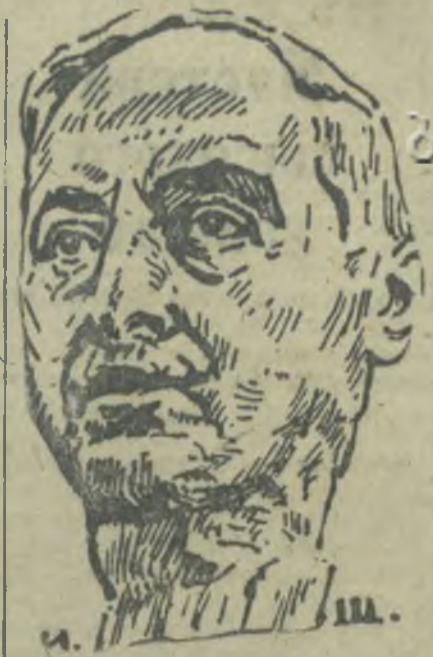
Рисунок худ. И. Шарлеманя с автопортрета Е. Татевосяна.

Его искусство ценными произведениями. Егеше Татевосян является высококультурной и техникой своего искусства. Он продолжил в 30 лет непрерывно готовил целое поколение молодых художников.