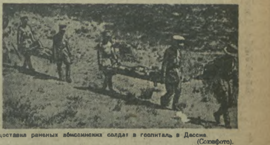
Часть раненых абиссинских солдат в госпитале в Дессисе.

Париж, 23 (ЗТА). Президиум Коминтерна приветствует VIII съезд коммунистической партии Франции. Съезд открылся в Виллербане в рабочем предместье города Ливона. Над столицей Франции восторженно приветствуют делегатов съезда. Съезд открылся в Виллербане в рабочем предместье города Ливона. Над столицей Франции восторженно приветствуют делегатов съезда.