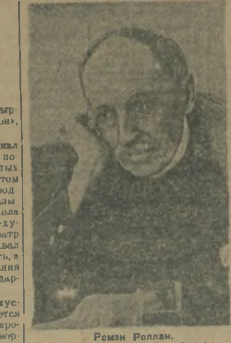
Ромэн Роллан. (Самфотос).