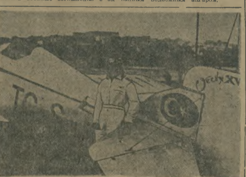
Первый турецкая летчик Бейра-хану.

РИМ, 27 (ЗТА). «Пополо д'Италия» — газета, которую объединили в последнее время близкие к правительственным кругам, резко высказывается в защиту германских «аргументов», направленных против франко-английского соглашения. В предыдущей статье «Пополо д'Италия» пишет: «Если секретные франко-английские военные соглашения касаются также Рейна и имеют в виду непосредственно Германию, то они нарушают договорное равновесие в будущей прачной тяжелой сложной ситуации...».