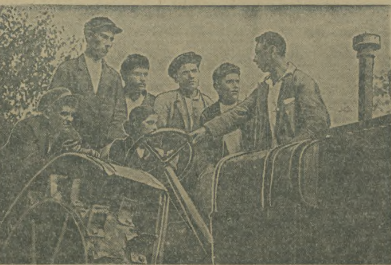
В Геокчев охоро состоялся выпуск трактористов и механиков республиканской тракторной школы. Это третий выпуск. Первые два дали машино-тракторным станциям около 100 квалифицированных трактористов и тракторных бригад.