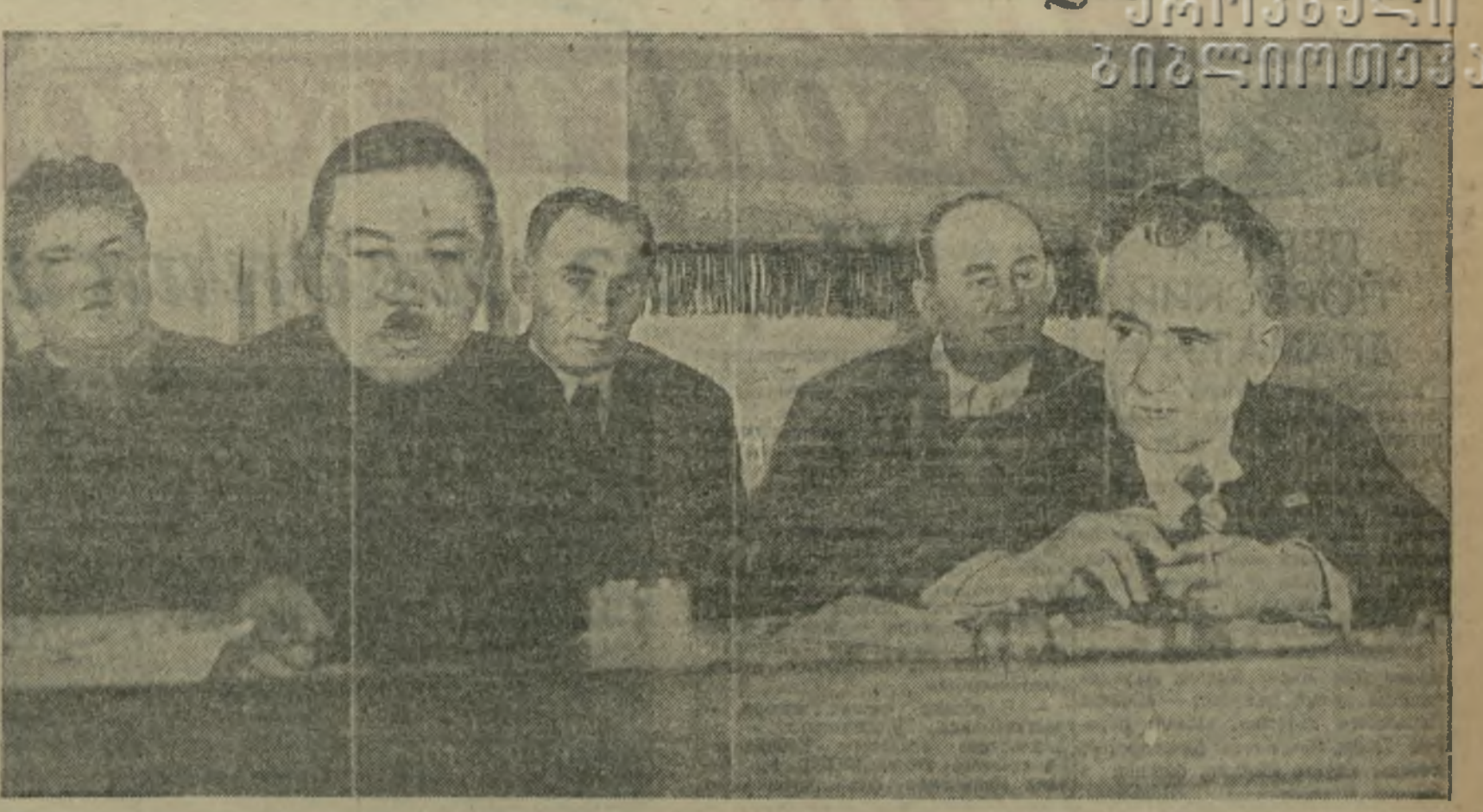
В президиуме сессии: гг. Л. БЕРИЯ, Г. МУСАБЕКОВ, О. МАРТИНЯН, Г. МГАЛОБЛИШВИЛИ, РОДИОНОВ, (Фото Иагорного).

Вчера в Красном зале Дворца правительства ЦК ЦК открылась третья сессия VII созыва Центрального Исполнительного Комитета ЗСФСР.