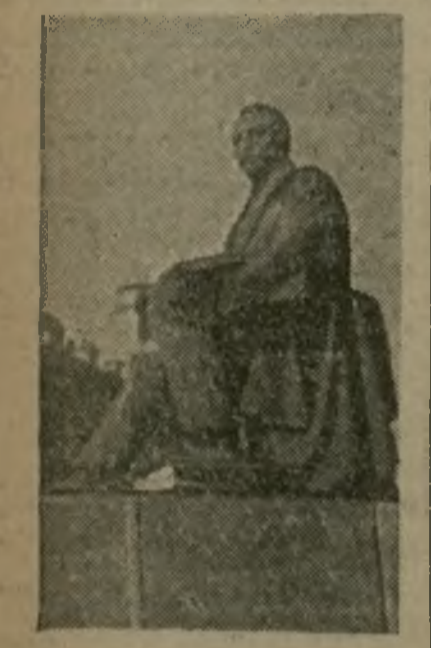
Памятник драматургу Мире Фатали Ахундову в Баку

Мира Фатали Ахундов — основоположник современного тюркского литературного языка, писатель и драматург. В 1882 году в Тифлисе открылся первый на Кавказе театр. В этом театре Мира Фатали Ахундов выступил со своей комедией «Медведь, поедатель разбойника».