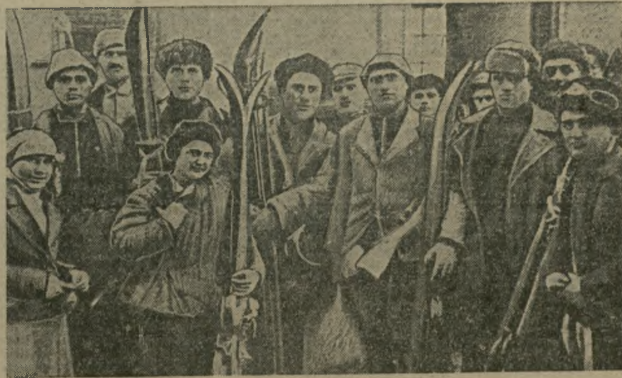
Группа сванов-альпинистов, прибывших в Тифли

Обширные базы Общества полярского туризма и экскурсий Грузии выполнялись своеобразными, горным сванским говором. Мы знакомимся с дорожными гостями, с людьми, вписанными в историю страны в историю советского альпинизма.