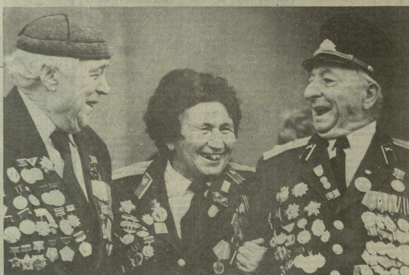
«...Фронтовики, наденьте ордена!»