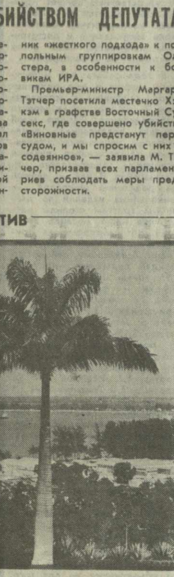
Курортный город Пуэрто-де-ла-Круз на Канарских островах (на снимке) круглый год привлекает к себе множество туристов и любителей моря и солнца.