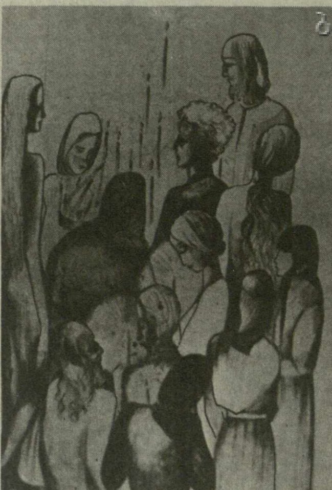
На снимках: Этери Митгавария; картина «Прихожане».